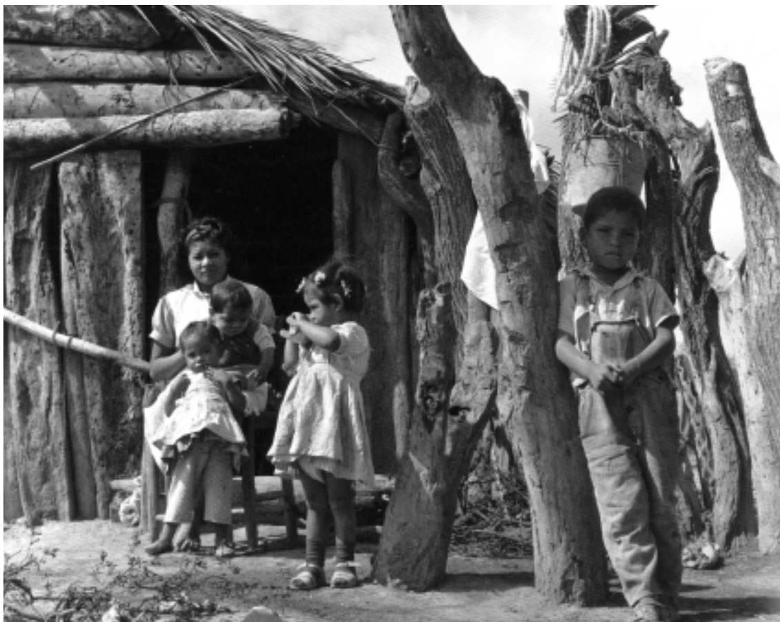
Región ixtletera del norte de México, 1966.

cando un difícil equilibrio entre su postura universalista y los elementos que incorpora del comunitarismo. Dieterlen analiza tres ideas de Charles Taylor: 1) quien contribuye más al bien común merece más (principio de la contribución mitigada); 2) que las sociedades occidentales han valorado de manera independiente los principios de la contribución y el principio republicano (que valora la libertad individual y la capacidad personal de deliberar en comunidad), y que la unión de ambos principios sólo se daría en la medida en que nos acercáramos a una vida comunitaria en la que fueran posibles tanto el autogobierno como la autogestión; 3) lo que estaría en juego es el proyecto de una sociedad diferente. Dieterlen encuentra un punto de unión entre los comunitaristas y